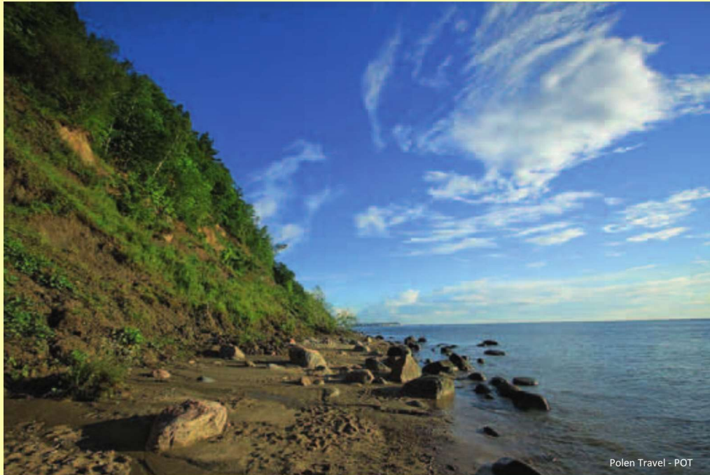
Polen Travel - POT