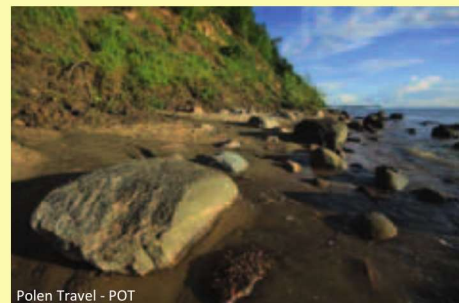
Polen Travel - POT