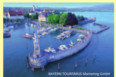
BAYERN TOURISMUS Marketing GmbH