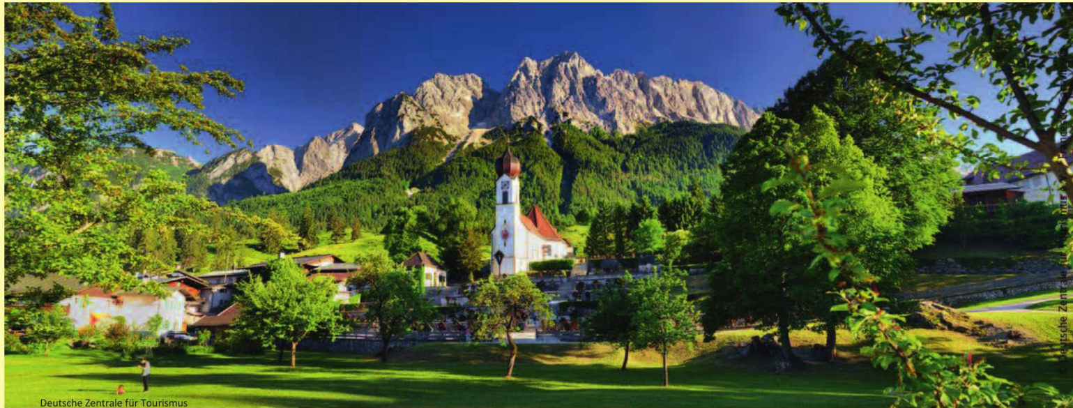
Deutsche Zentrale für Tourismus