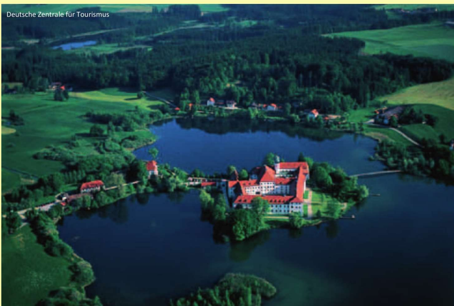
Deutsche Zentrale für Tourismus

Nach einem typisch bayerischen Frühstück mit frischen Weißwürsten, brechen Sie auf ins Berchtesgadener Land. Die Fahrt über die Roßfeld-Panoramastraße, Deutschlands höchstgelegener Panoramastraße ist ein unvergessliches Erlebnis. Sie führt hinauf auf eine Höhe von 1.600 m und bietet auf der Scheitelsecke einen atemberaubenden Ausblick in das Berchtesgadener und Salzburger