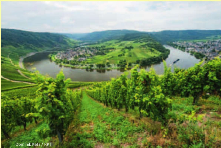
Dominik Ketz / RPT