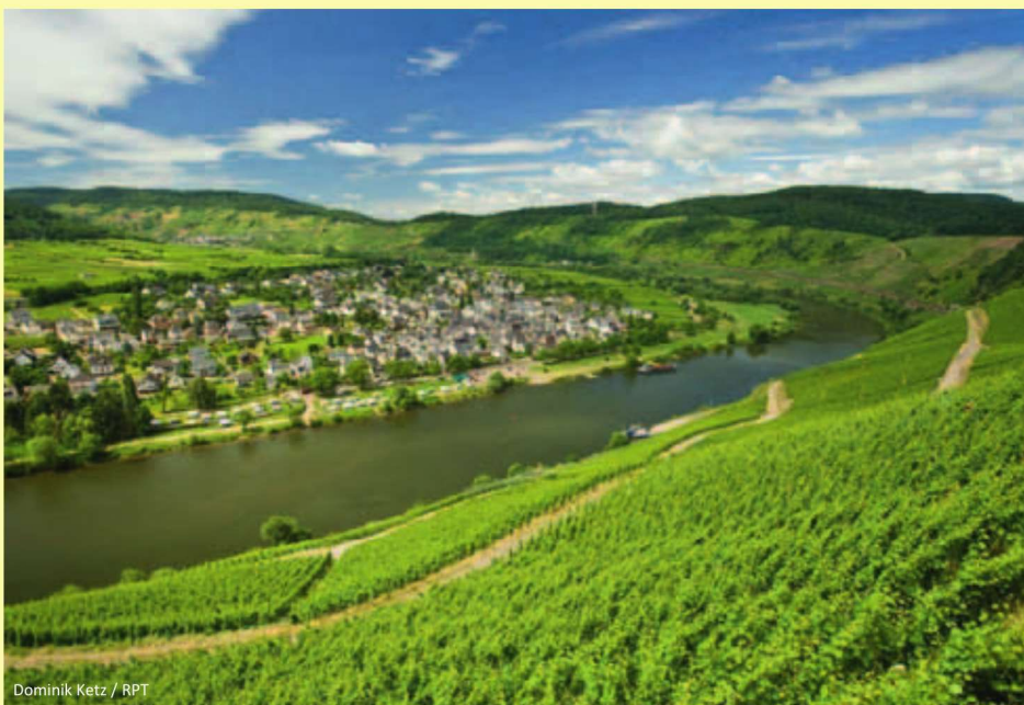
Dominik Ketz / RPT

Nach dem Frühstück steht der Bus für die Heimreise bereit. Eine beeindruckende Reise geht zu Ende.