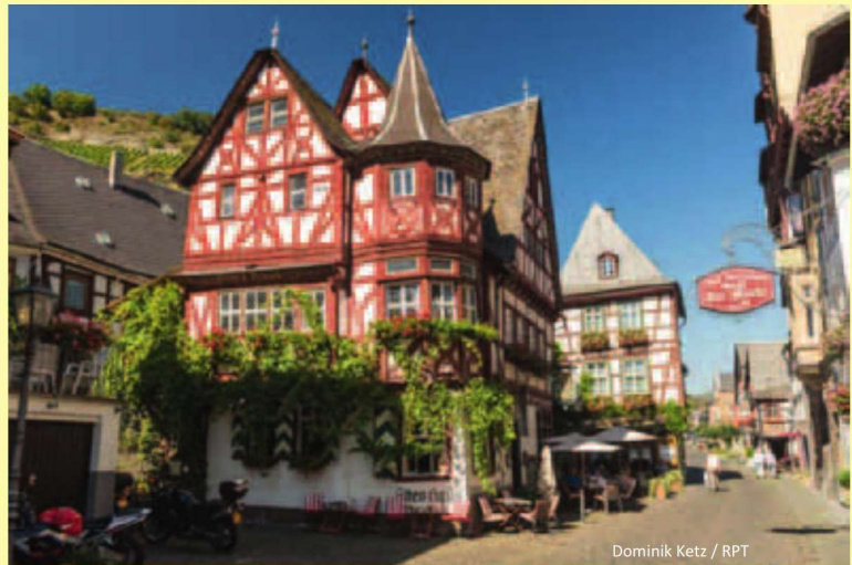
Dominik Ketz / RPT