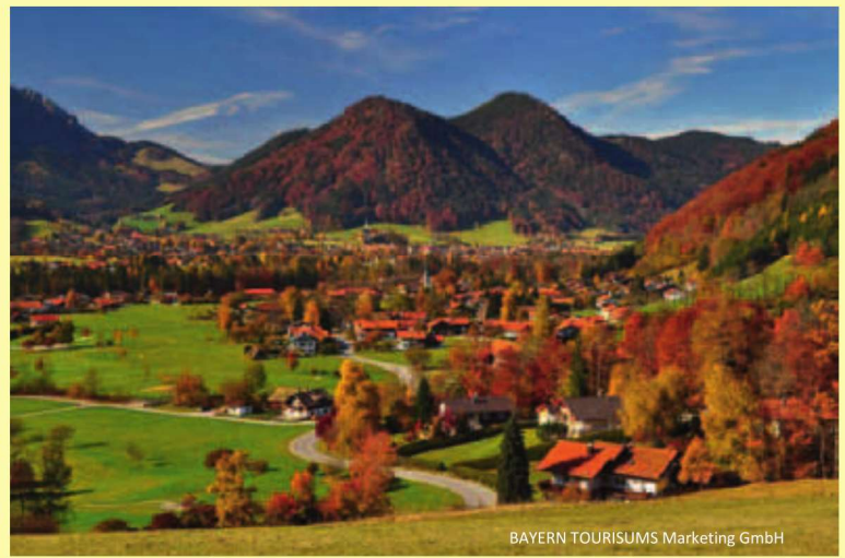
BAYERN TOURISMUS Marketing GmbH