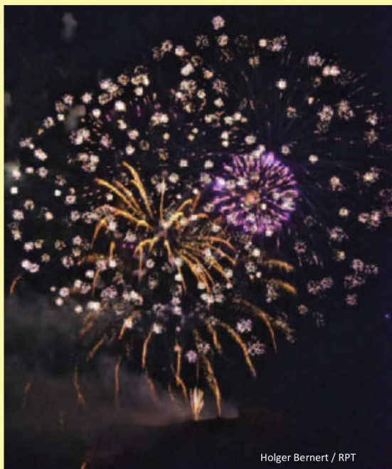
Holger Bernert / RPT