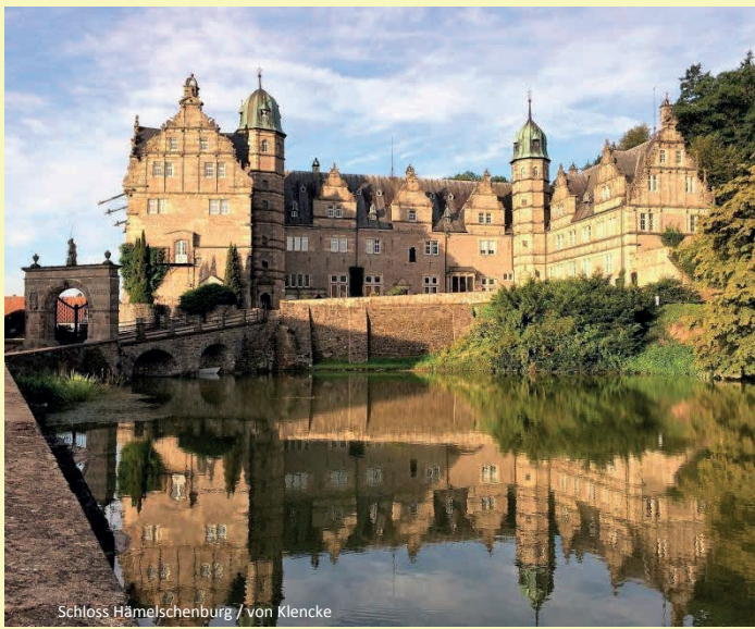
Schloss Hämelschenburg / von Klencke