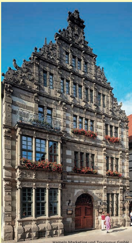
Hameln Marketing und Tourismus GmbH