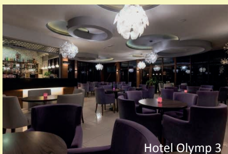
Hotel Olymp 3

Das Hotel Olymp 3 **** wurde 2013 neu eröffnet. Es befindet sich unmittelbar im Kurzentrum, nur ca. 300 m von der Ostsee entfernt. Die berühmte Seebrücke ist in etwa 15 Gehminuten zu erreichen und bis in die Kolberger Altstadt sind es ca. 20 Minuten zu Fuß. Die 164 Zimmer sind modern eingerichtet und verfügen über Dusche/WC, Föhn, Sat-TV, Kühlschrank, Telefon und überwiegend Balkon. Einzelzimmer sind Doppelzimmer zur Alleinbenutzung. Alle Mahlzeiten finden in Büfettform statt. Im Spa- und Wellnessbereich befinden sich eine Kurabteilung, Hallenbad (12 x 6 m), Whirlpools, Sauna, Dampfbad und Fitnessraum. Außerdem finden Sie im Hotel eine Rezeption, ein Restaurant, zwei Cafés, eine Dachterrasse, eine Bowlingbahn und einen Kosmetik- und Friseursalon.