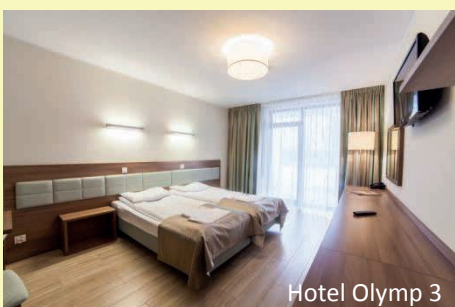
Hotel Olymp 3