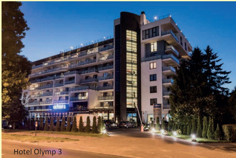
Hotel Olymp 3