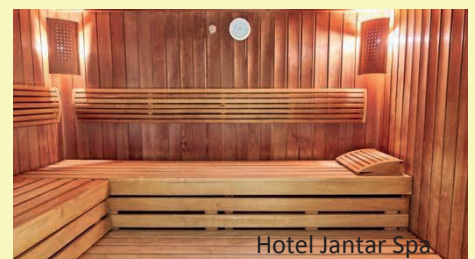
Hotel Jantar Spa