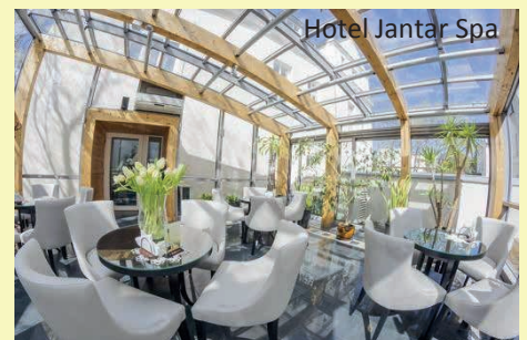
Hotel Jantar Spa