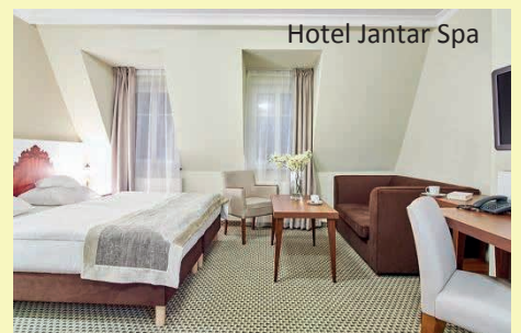
Hotel Jantar Spa