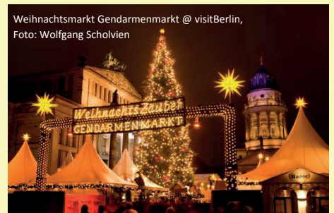
Weihnachtsmarkt Gendarmenmarkt

Wir empfehlen Ihnen den Abschluss einer Reiserücktrittsversicherung