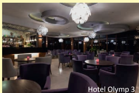
Hotel Olymp 3

Das Hotel Olymp 3 **** wurde 2013 neu eröffnet. Es befindet sich unmittelbar im Kurzentrum, nur ca. 300 m von der Ostsee entfernt. Die berühmte Seebrücke ist in etwa 15 Gehminuten zu erreichen und bis in die Kolberger Altstadt sind es ca. 20 Minuten zu Fuß. Die 164 Zimmer sind modern eingerichtet und verfügen über Dusche/WC, Föhn, Sat-TV, Kühlschrank, Telefon und überwiegend Balkon. Einzelzimmer sind Doppelzimmer zur Alleinbenutzung. Alle Mahlzeiten finden in Büfettform statt. Im Spa- und Wellnessbereich befinden sich eine Kurabteilung, Hallenbad (12 x 6 m), Whirlpools, Sauna, Dampfbad und Fitnessraum. Außerdem finden Sie im Hotel eine Rezeption, ein Restaurant, zwei Cafés, eine Dachterrasse, eine Bowlingbahn und einen Kosmetik- und Friseursalon.