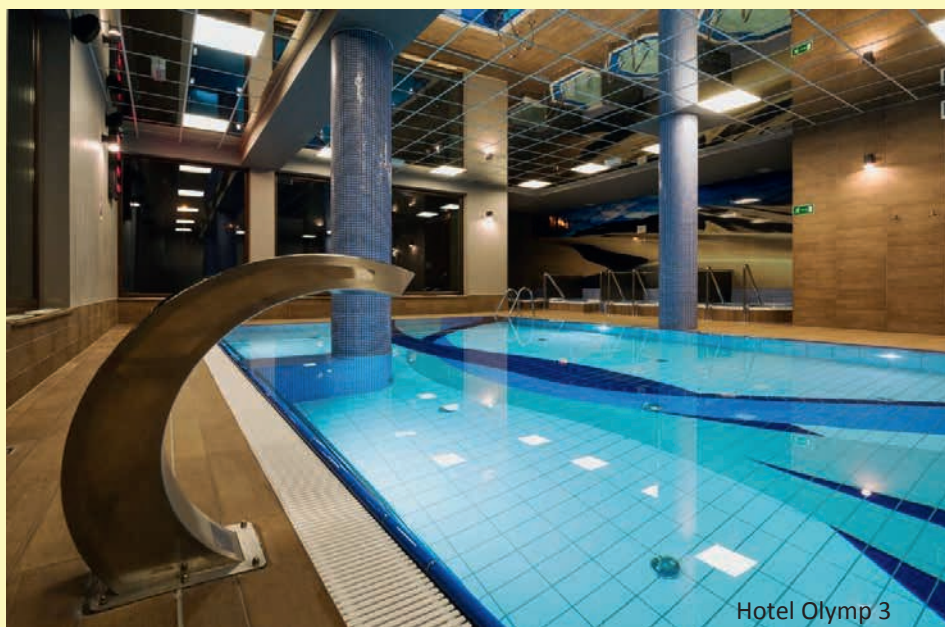
Hotel Olymp 3