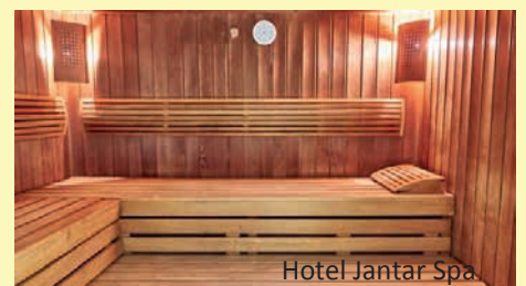
Hotel Jantar Spa