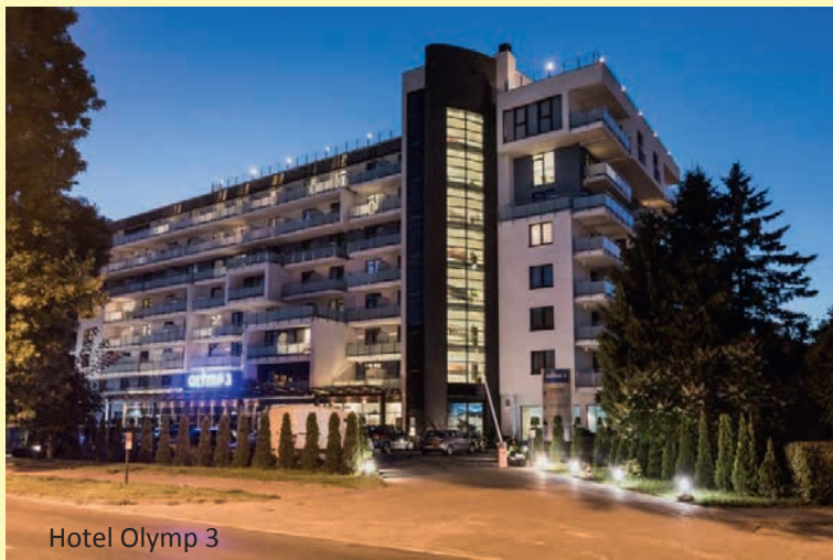
Hotel Olymp 3