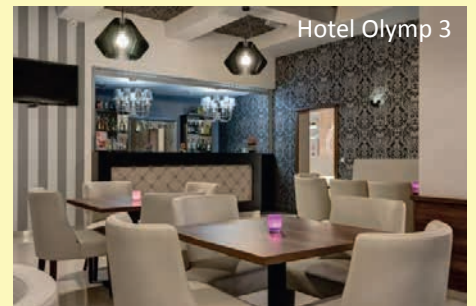
Hotel Olymp 3