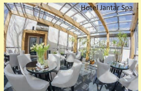
Hotel Jantar Spa