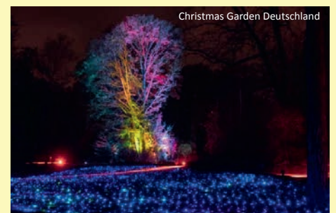
Christmas Garden Deutschland