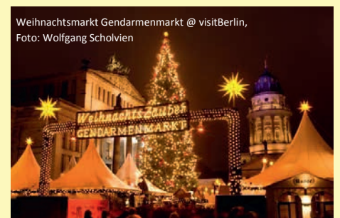
Weihnachtsmarkt Gendarmenmarkt