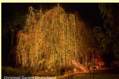
Christmas Garden Deutschland

Wir empfehlen Ihnen den Abschluss einer Reiserücktrittsversicherung