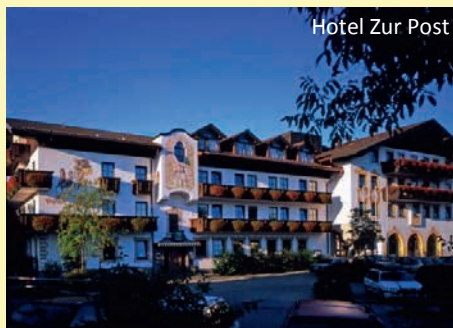
Hotel Zur Post

So wohnen Sie: Das seit Generationen in Familienbesitz befindliche Hotel Zur Post ***S liegt im ruhigen Ortskern von Rohrdorf. Gemütliche, mit viel Liebe gestaltete Stuben und der lauschige Biergarten mit alten Linden laden zum Verweilen ein. Alle Zimmer verfügen über Dusche, WC, Kabel-TV, Telefon, Föhn, Safe und sind mit dem Lift erreichbar. Das Haus ist bekannt für seine hervorragende Küche und bayerische Schmankerl.