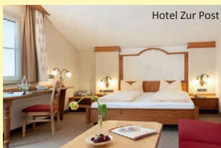
Hotel Zur Post