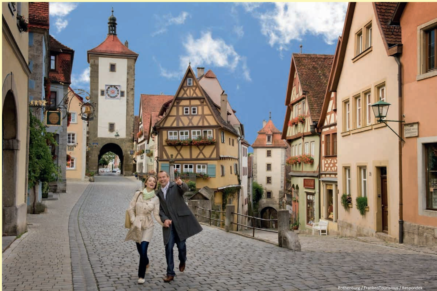
Rothenburg / FrankenTourismus / Respondek