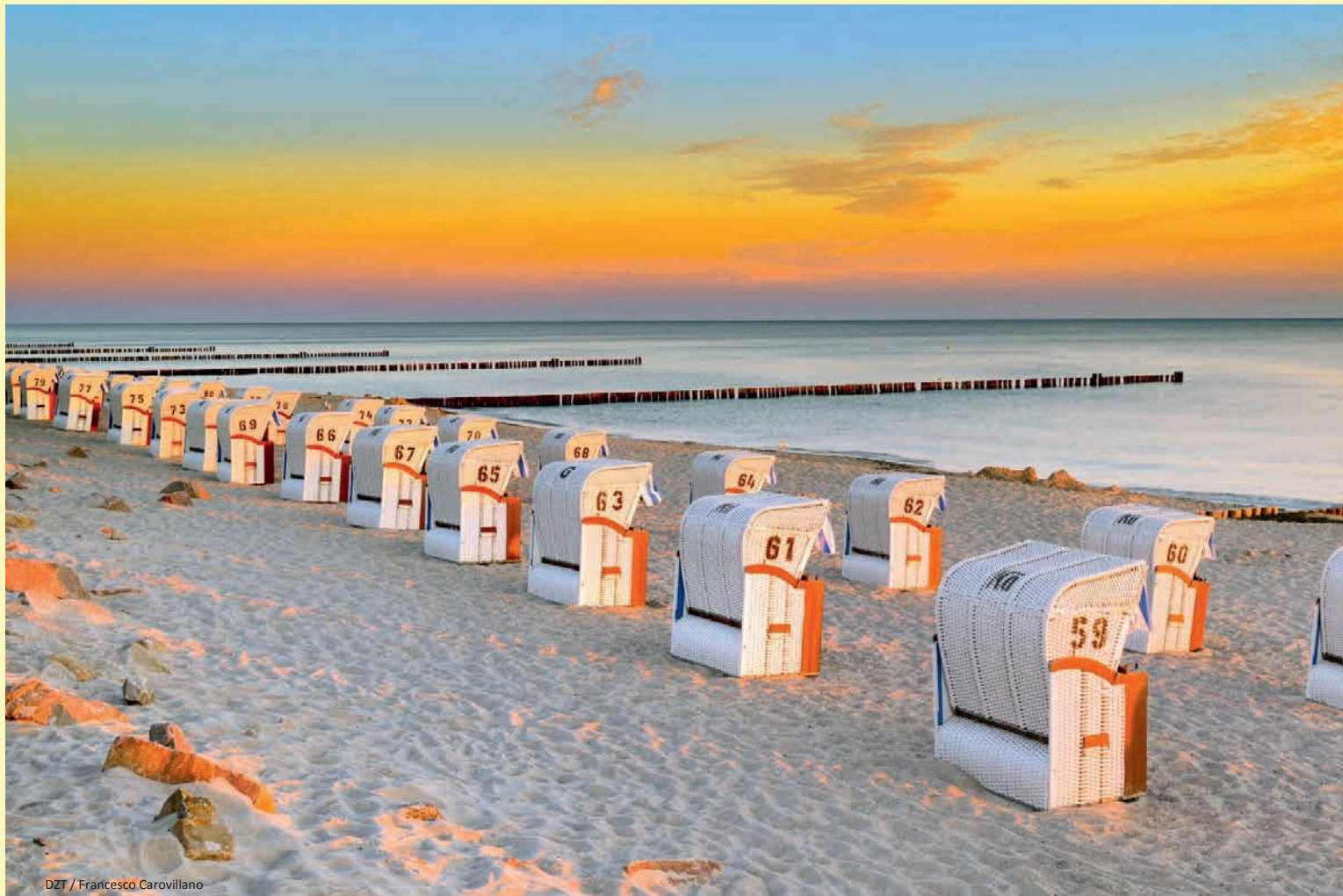
DZT / Francesco Carovillano