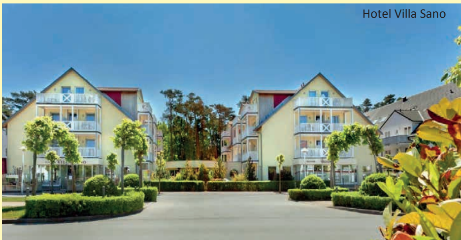
Hotel Villa Sano

So wohnen Sie: Sie wohnen im Hotel Villa Sano Baabe *** . Die einladende Flaniermeile von Baabe finden Sie direkt vor der Tür und der Ostseestrand liegt gerade mal fünf Minuten entfernt. Das Hotel verfügt über moderne Zimmer mit Bad/WC, Kabel-TV, Telefon, Safe und Föhn. Als Familien- und Gesundheitshotel dreht sich in der Küche alles um Ihr Wohlbefinden. Das Küchenteam verarbeitet besonders frische und gesunde Zutaten aus der Region. Ein Fahrstuhl ist vorhanden. Entspannung nach den Tagesausflügen finden Sie in verschiedenen Saunen.