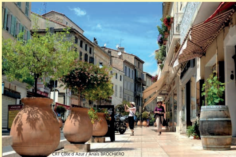
CRT Côte d'Azur / Anaïs BROCHIERO