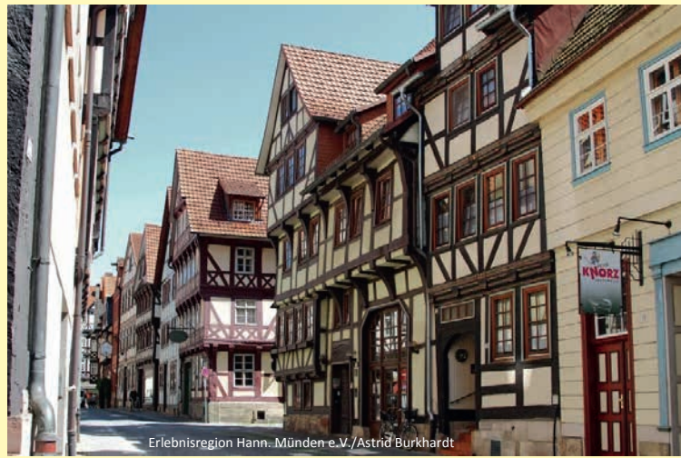
Erlebnisregion Hann.-Münden e.V./Astrid Burkhardt