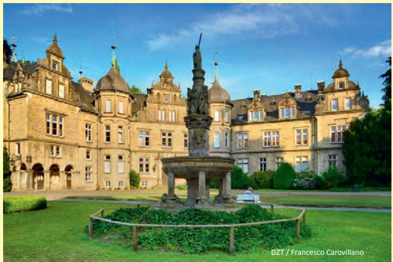
DZT / Francesco Carovillano