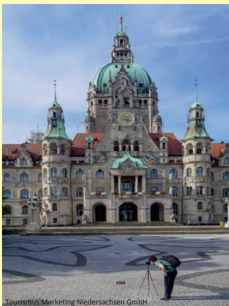
Tourismus Marketing Niedersachsen GmbH