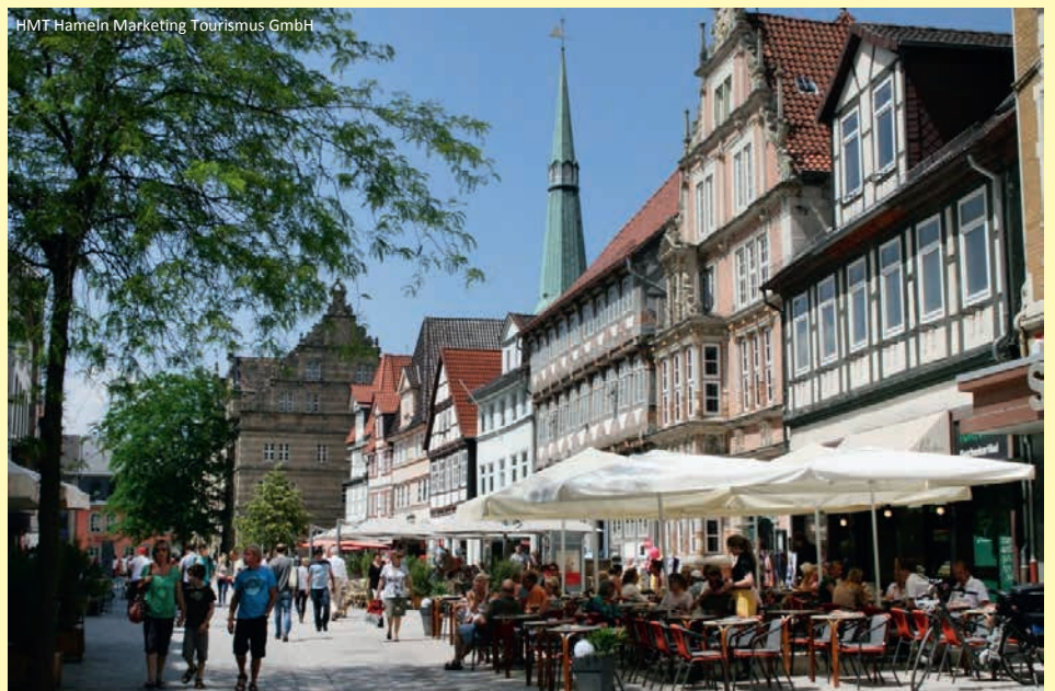
HMT Hameln Marketing Tourismus GmbH