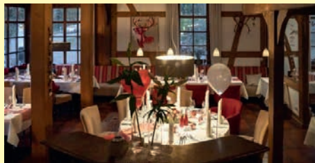
Hotel Große Klus