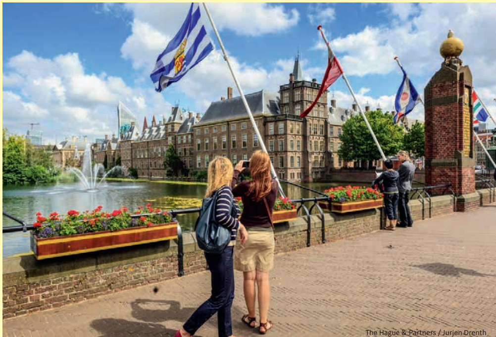
The Hague & Partners / Jurjen Drenth