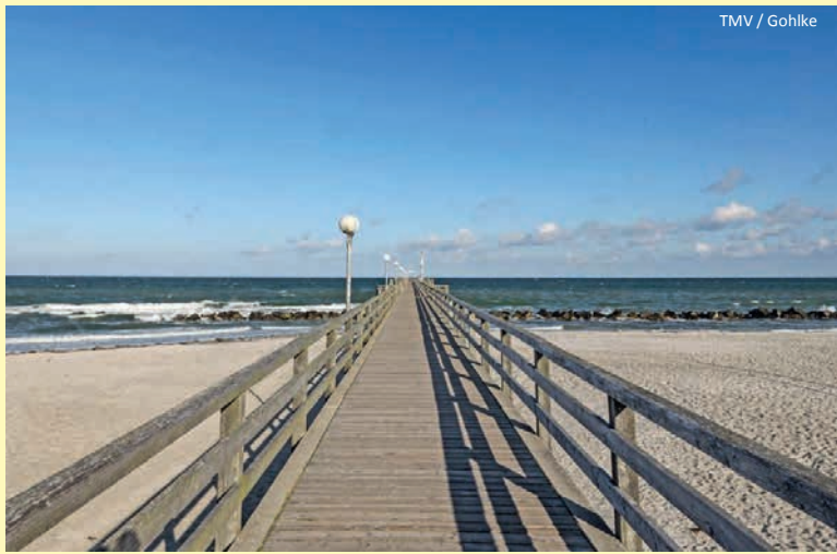
TMV / Gohlke