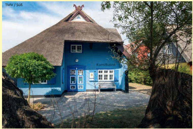
TMV / Süß