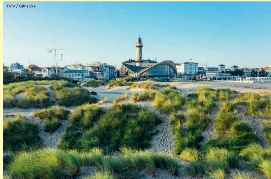
TMV / Gänsicke

Wir empfehlen den Anschluss einer Reiserücktrittsversicherung.