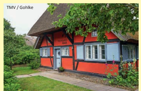
TMV / Gohlke