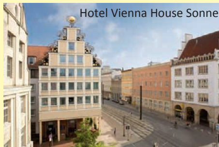
Hotel Vienna House Sonne

So wohnen Sie: Direkt im Herzen der Hansestadt Rostock und gleich gegenüber dem imposanten Rathaus liegt das Hotel Vienna House Sonne Rostock. Von hier aus geht es zur Shoppingmeile der Stadt. Die gut ausgestatteten Zimmer verfügen über Bad mit Dusche oder Wanne, Föhn, Telefon, TV, Safe, Schreibtisch und WLAN.