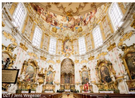
DZI / Jens Wegener

Rundfahrt zum eindrucksvollen Tegernsee und nach Bad Tölz. Bekannt geworden ist die Kurstadt vor allem durch ihre historische Altstadt mit den Häusern von Tölzer Kaufmannsfamilien und Patriziern sowie die malerische Marktstraße. Beim Flanieren auf Straßen und Plätzen laden Cafés und Restaurants unter bunt bemalten Barockgiebeln zum Verweilen und Genießen ein. Zurück führt die Route über Wildbad-Kreuth, vorbei am Sylvensteinstausee und durch den Isarwinkel mit Lenggries.