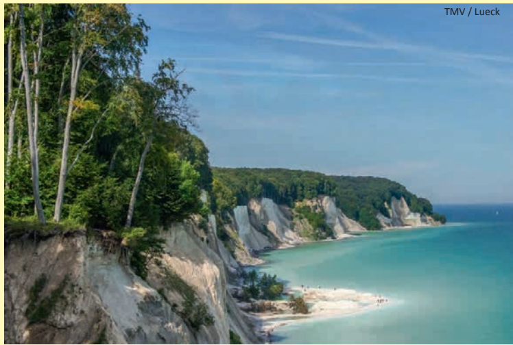
TMV / Lueck