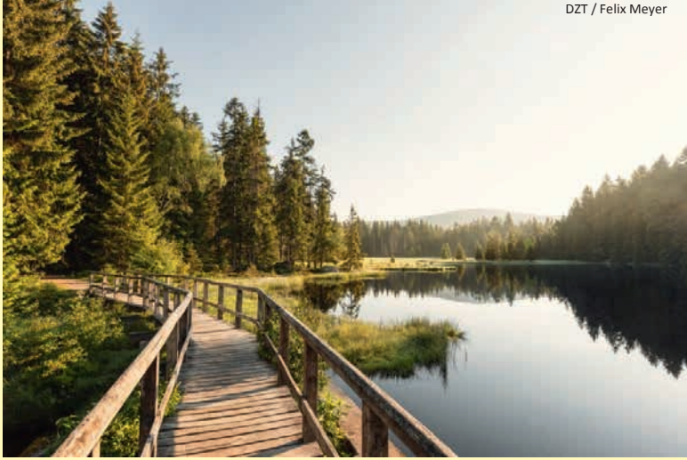
DZT / Felix Meyer