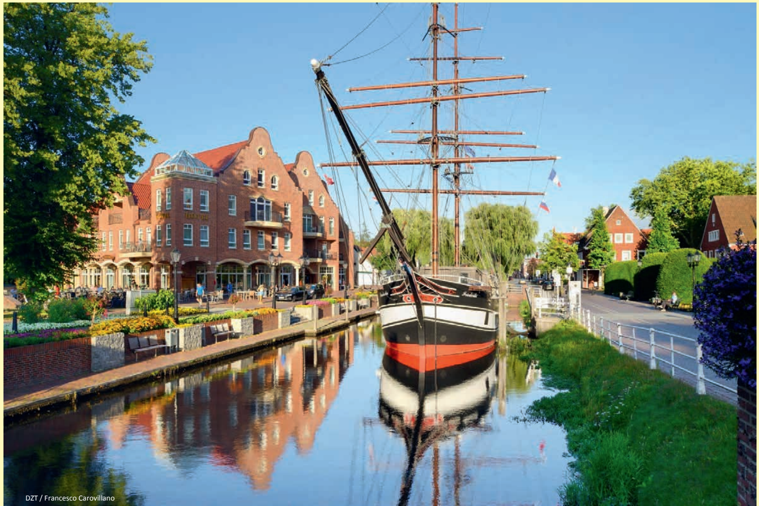
DZT / Francesco Carovillano